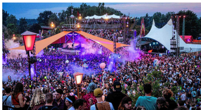
Auf dem Fusion-Festival feiern jährlich zehntausende Menschen.

Im November 2025 sagte das Verteidigungsministerium dem